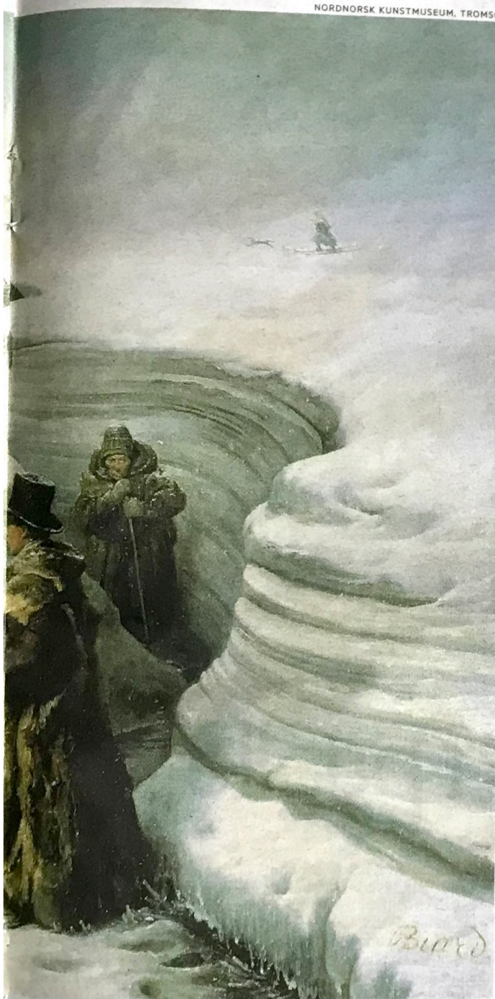
NORDNORSK KUNSTMUSEUM, TROMSØ

toinen tuttuja sävelmiä versioiva akustinen albumi, huonoimmassa taas varsin kalliit treenit. Akustinen Tuhkatkin pesästä -kiertue kertoo, mitä syntyi. Mokoma Rovaniemen Korundissa 23.2. kello 20.