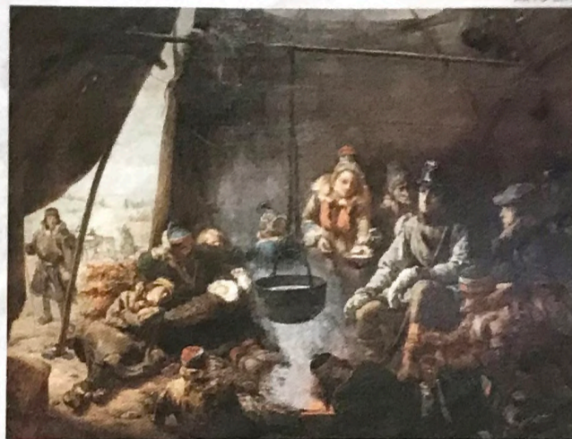
ORLÉANSIN herttua saamelaiskodassa, Louvren taidemuseo, Versailles.

● François-Auguste Biard: La Laponie Mythique – Myyttinen Lappi, Rovaniemen taidemuseossa Korundissa 18.6. 2017 saakka.