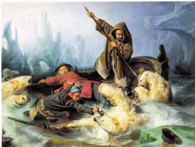
Embarcation attaquée par des ours blancs dans la mer du Nord

L'iconographie du Grand Nord était à la mode au milieu du XIX e siècle et circulait sous la forme de gravures populaires. Avant d'avoir eu la chance de pouvoir s'y rendre, Biard en faisait déjà des tonnes dans cette version outrancière, mais non sans verve.