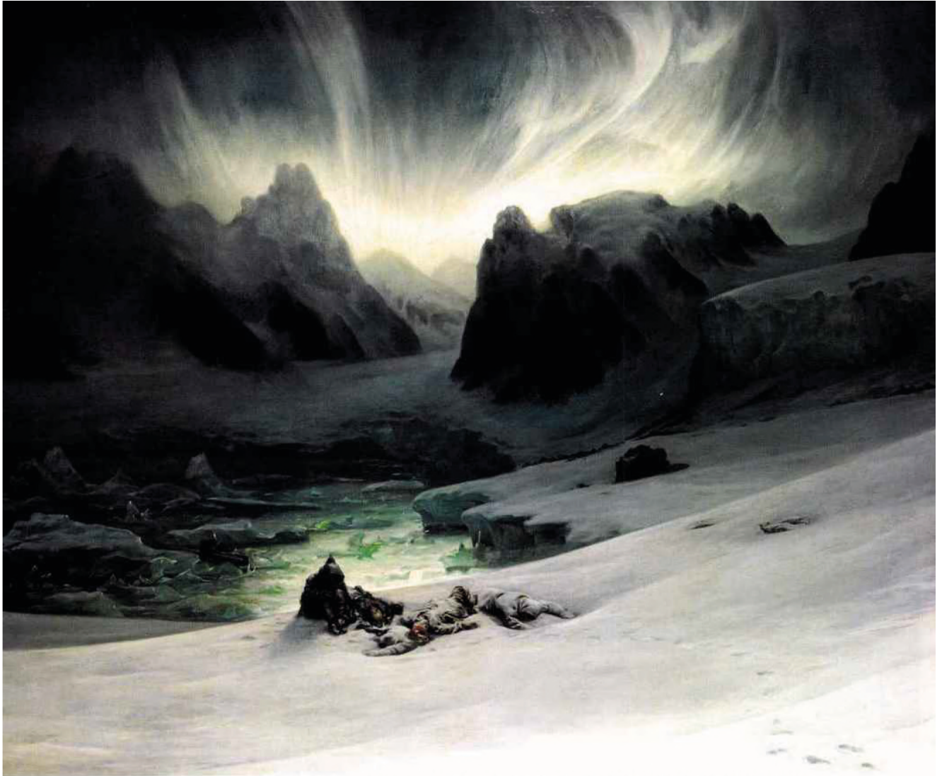
Magdalena Bay, vue prise de la presqu'île des Tombeaux, au nord du Spitzberg; effet d'aurore boréale

L'un des plus beaux tableaux de Biard, avec ce coup de lumière magistral se reflétant sur les eaux glacées. Sans conteste, son séjour au Spitzberg a changé le rapport du peintre au paysage. Pour autant, l'anecdote demeure avec ce personnage accroupi auprès de cadavres.