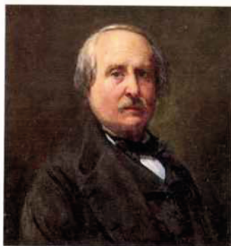
Autoportrait, vers 1870-1875