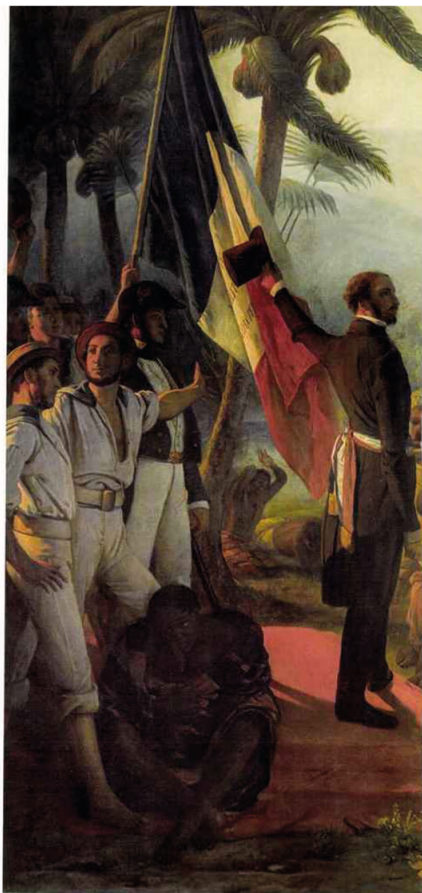
L'Abolition de l'esclavage dans les colonies françaises le 27 avril 1848

C'est aussi l'un des intérêts majeurs de cette exposition : replacer Biard dans son temps et narrer l'Histoire derrière la carte postale, l'illustration, en appelant à se méfier de la force des images. Biard l'aventurier n'était pas vraiment ethnographe, ni peintre d'histoire, mais davantage conteur, et plutôt courtisan que militant. Ce qui ne vaut pas non plus anathème... Théophile Gautier, pourtant lui aussi conteur dans l'âme et défenseur de «l'art pour l'art», lui fit le reproche de faire tomber la peinture au niveau de la caricature mais sans le talent d'Honoré Daumier, dont les œuvres ont aujourd'hui gardé toute leur force. Avec le recul, comment le contredire ? ■