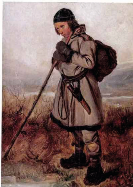
Jeune Sami debout appuyé sur une canne

Très vite, la bougeotte le reprend et Biard part sur les routes de Grande-Bretagne, d'Écosse, d'Allemagne et de Suisse avant de se fixer à Paris en 1835, dans un atelier de la place Vendôme, où il connaît un certain succès. Ses œuvres, dont la critique déplore déjà la part anecdotique, séduisent un large public. Dès 1838, il s'installe avec la jeune Léonie d'Aunet. C'est par son entremise que va s'organiser la première véritable aventure de Biard : une expédition dans le Grand Nord. En juillet 1839, le couple embarque en toute discrétion sur le navire la