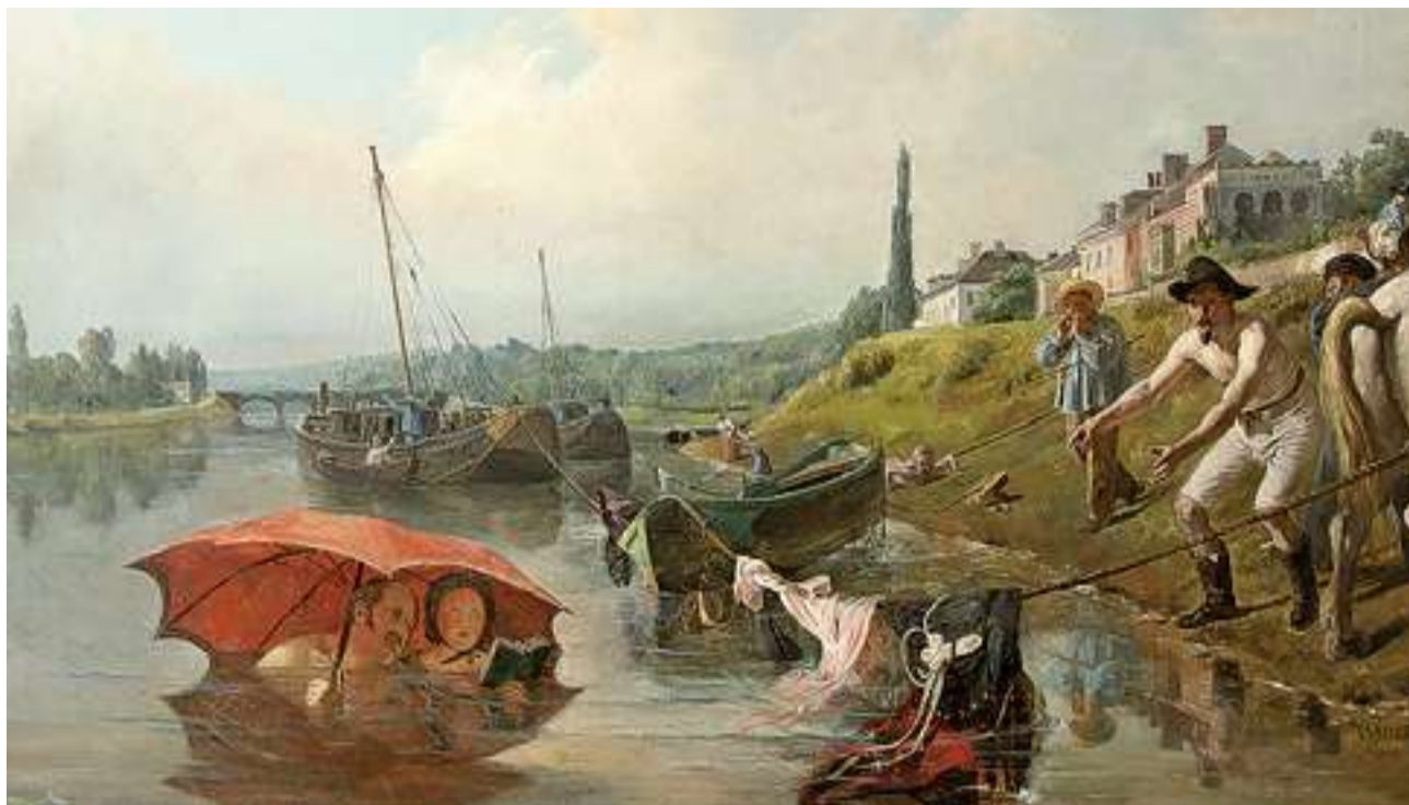
François-Auguste Biard - Le halage, Tomasselli Collection, Lyon

Si Biard est sorti des radars de l'histoire de l'art, c'est entre autres parce que son œuvre part un peu trop dans toutes les directions. Pour circonscrire son parcours, l'exposition prend le parti d'une approche thématique et démarre avec une section consacrée aux Salons. À proximité de plusieurs des tableaux burlesques qui ont fait le succès populaire de Biard lors de ces fameux raouts artistico-mondains, un mur donne un aperçu des critiques plus ou moins cinglantes qui lui ont été destinées. En effet, reconnu à l'époque pour ses peintures potaches qui moquaient gentiment ses contemporains, il n'était pas toujours apprécié des critiques. Après un détour du côté de la peinture sociale (l'intimité dramatique d'une famille visitée par les huissiers ou une très théâtrale scène